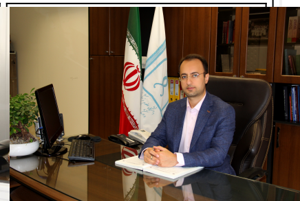
دکتر خسرو ادیب کیا