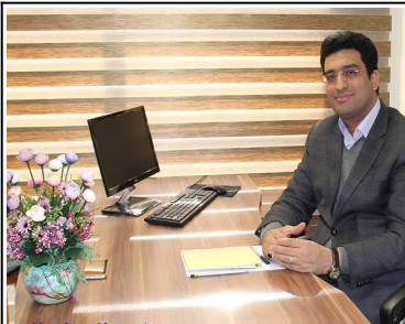
دکتر طاهر انتظاری