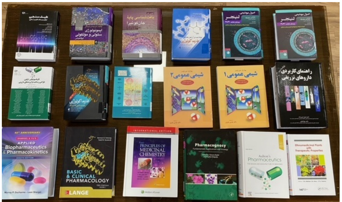
کتاب لاتین سال 1401