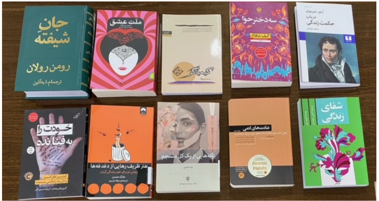
کتاب فارسی سال 1401