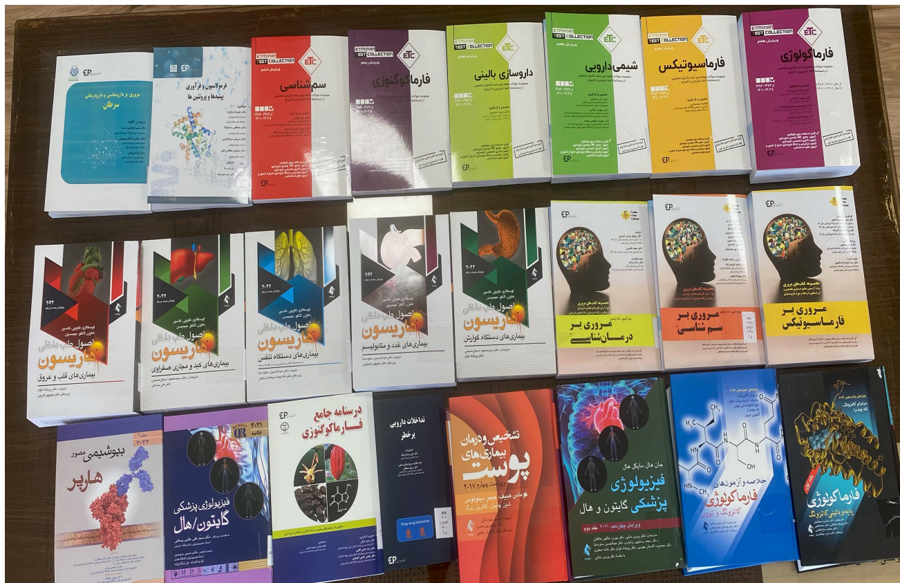
کتاب لاتین سال 1402